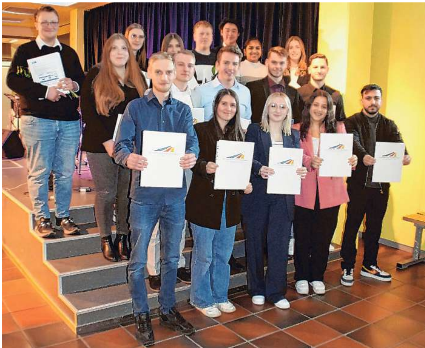
Erfolgreich die Ausbildung abgeschlossen – ein Teil der stolzen Absolventen.