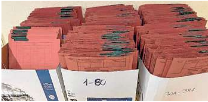
381 Akten wegen jeweils Betrugsverdacht mussten gegen den Beschuldigten gefertigt werden.

RINTELN (ds). Die Rintelner Polizei ermittelt seit mehr als einem halben Jahr in einem umfangreichen Betrugsverfahren gegen einen 29-jährigen Mann aus einem Rintelner Ortsteil. Die Masche des Mannes: In gängigen Portalen werden diverse Gegenstände eingestellt, die zum Preis von bis zu etwa 60 Euro angeboten und schließlich verkauft wurden. Nachdem die Geschädigten den fälligen Betrag über das Zahlungssystem PayPal „Freunde und Familie“ an den Beschuldigten übersandten, gab es allerdings keine Ware gegen das Geld. Wegen insgesamt 381 Straftaten mit Geschädigten aus dem gesamten Bundesgebiet und auch über die Grenzen Deutschlands hinaus wurde gegen den Beschuldigten ermittelt, bei einem Gesamtschaden von etwa 7.400 Euro. Auffällig dabei war, dass viele der Ge-