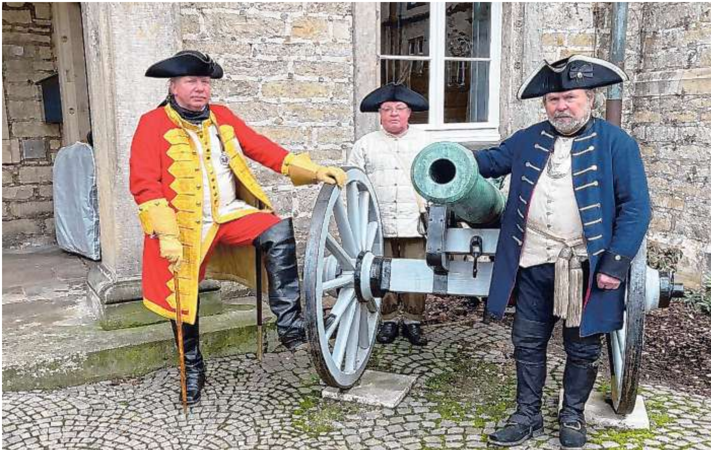
Graf Wilhelm mit Knappen und Kanonier.