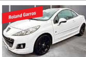
Peugeot 207 CC 1.6 VTI 120 84.860 km, 88 kW (120 PS), EZ 06/2013

Klimaanlage, Einparkhilfe, Android Auto, Apple CarPlay, Bluetooth, Bordcomputer, Isofix, Navigationssystem, Notbremsassistent, Panorama-Dach, Radio DAB, Scheckheftgepflegt, Sitzheizung, Start/Stop-Automatik, Tempomat, USB uvm. € 9.455,-