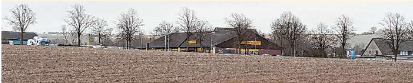
Der Blick aus dem Neugebiet Teichbreite in Richtung Anschluss Gewerbegebiet Niedere Heide II.

Bebauungsfläche, wobei es bisher einen Interessenten gibt.