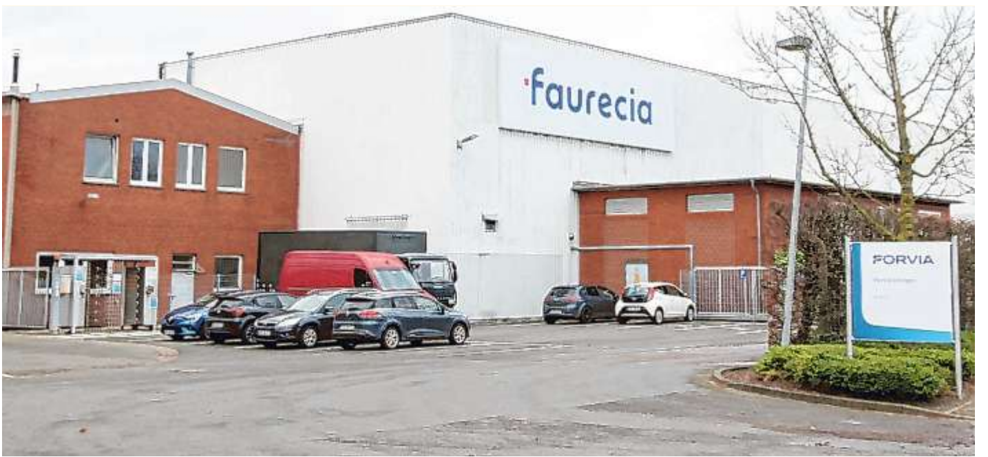
Faurecia will die Zahl der Stellen in Stadthagen ganz massiv abbauen.