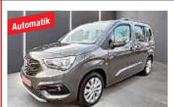
Opel Combo 1.2 Turbo INNOVATION 53.243 km, 96 kW (131 PS), EZ 01/2020

Klimaanlage, Anhängerkupplung fest, ESP, Partikelfilter, Scheckheftgepflegt, Trennwand, Zentralverriegelung, Bluetooth, Radio-CD, beheizbarer Außenspiegel, Klangpaket uvm. € 14.161,-