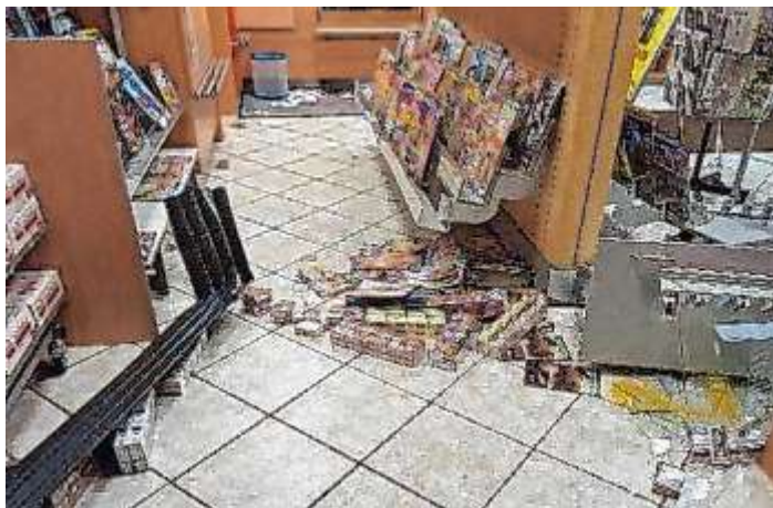
Der Innenraum des Tabakwarenladens.

RINTELN (ds). Am Samstag, 20. Januar, waren nach bisherigen Erkenntnissen der Polizei gegen 23.31 Uhr, drei bislang unbekannte männliche Tatverdächtige in eine Bäckerei in der Braasstraße eingestiegen. Dort hebelten die Täter die Eingangstür der Bäckerei auf. Durch die Räumlichkeiten der Bäckerei gelangen sie nach Aufbrechen eines Rolltores in den danebenliegenden Tabakwarenladen. Dort wurden Schubladen aus dem Verkaufsbereich aufgerissen und mehrere Zigaretten-