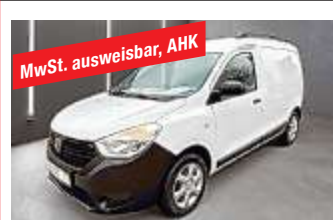
Dacia Dokker Express Essential 1,6 ScE 45.340 km, 75 kW (102 PS), EZ 08/2019

Klimaanlage, Einparkhilfe, Bluetooth, Bordcomputer, CD-Spieler, Freisprecheinrichtung, Isofix, Kurvenlicht, Navigationssystem, Reifendruckkontrolle, Scheckheftgepflegt, Sitzheizung, Sommerreifen, Sportsitze, Tempomat, Tuner/Radio, USB, Winterpaket uvm. € 10.207,-