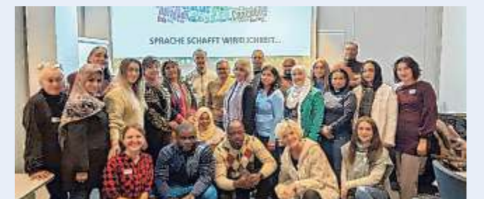
Die Sprachmittler erreichen 2023 ein Rekordergebnis bei den Unterstützungsleistungen.

Der Pool ist ein Kooperationsprojekt der Koordinierungs-