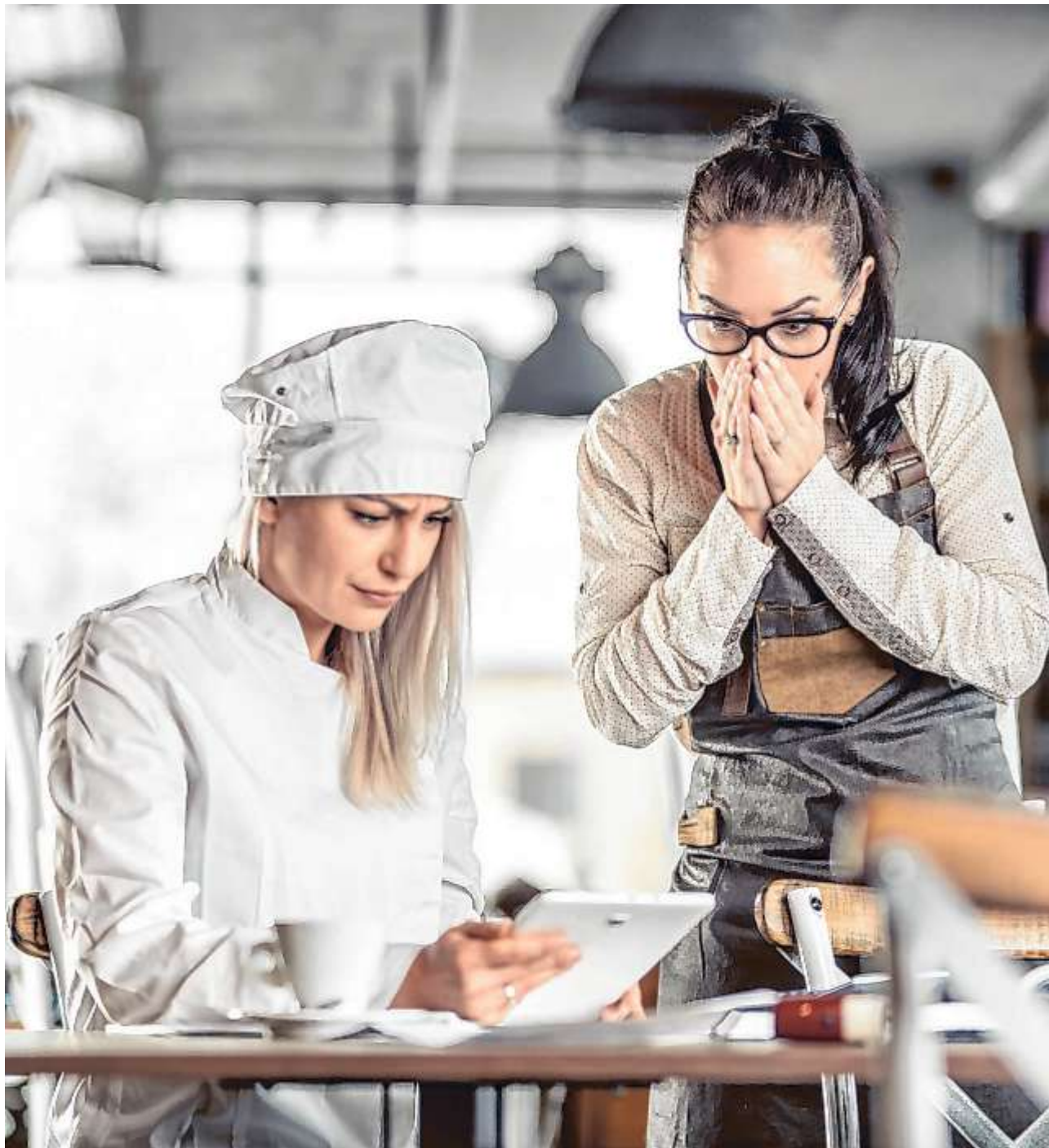
Müssen mit dem Jahreswechsel neu kalkulieren: Gastronomische Betriebe.

Landgasthaus Fischer Auf der Riehe 11 • 31555 Suthfeld