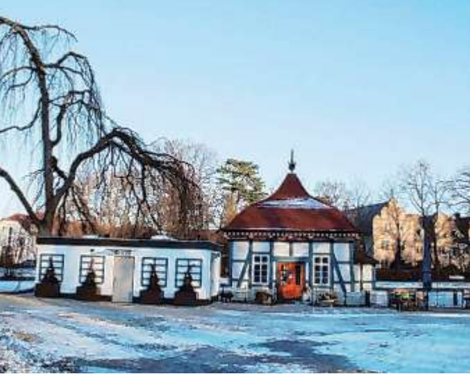
Soll zukünftig auch im Winter geöffnet bleiben. SPD und CDU freuen sich auf dementsprechende Konzepte.

Die Schließung des Lusthauses in den Wintermonaten war einer nicht offiziellen Quelle zufolge im geltenden Pachtvertrag nicht vorgesehen. Da die Stadt als Vermieter der Immobilie fungiert, hätte der Verwaltungsausschuss einer Streichung dieses Passus zustimmen müssen.