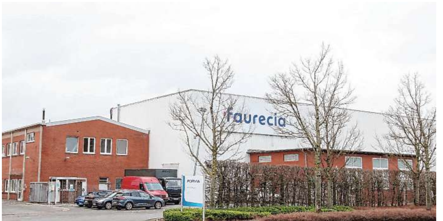
Faurecia plant einen weiteren massiven Stellenabbau am Standort in Stadthagen. Die Zahl der Arbeitsplätze soll von 285 auf 49 heruntergefahren werden.