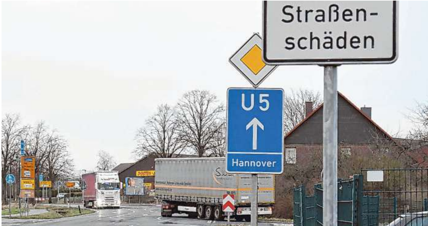
Die Anbindung an die A2 macht die Neuerschließung besonders attraktiv – der Verkehr wird aber zunehmen.

Das dort, nord-westlich der Rehrener Straße (L 443) geplante Vorhaben einer Hannoveraner Grundstücksgesellschaft umfasst ein Logistikzentrum mit drei größeren Hallen. Diese würden mit großer Wahrscheinlichkeit in Sichtnähe zum Neubaugebiet Teichbreite gebaut werden. Östlich und westlich des neuen Gewerbegebiets grenzen landwirtschaftlich genutzte Flächen an das Gebiet an. Angedacht sind rund 95.000 Quadratmeter