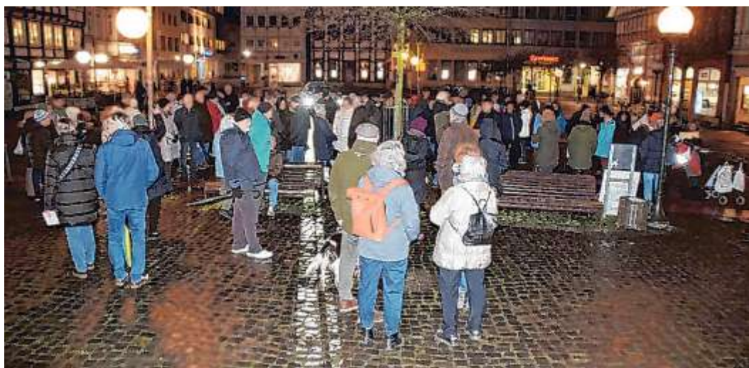
Rund 100 Zuhörer versammelten sich auf dem Marktplatz.