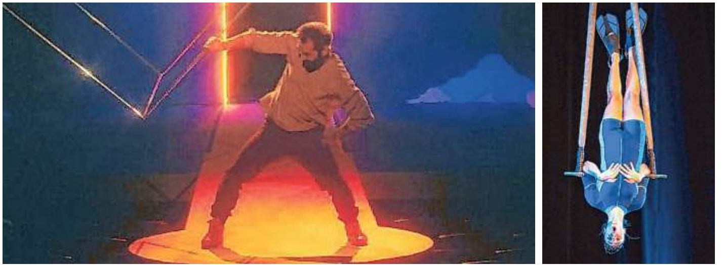
Die Akrobatik-Show Seasons lädt in den Osterferien Kinder kostenlos in der Begleitung eines zahlenden Erwachsenen ein.