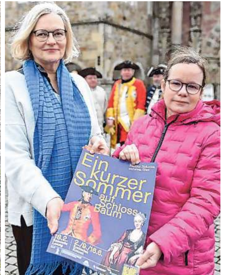
Veranstaltung Schloss Baum.