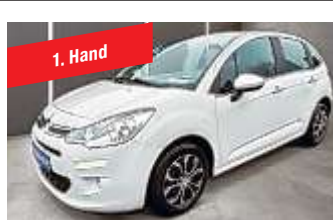
Citroën C3 1,2 e-VTi Pure Tech 82 55.105 km, 60 kW (82 PS), EZ 09/2015

Klimaanlage, Einparkhilfe, Android Auto, Apple CarPlay, Bluetooth, Bordcomputer, Isofix, Navigationssystem, Notbremsassistent, Panorama-Dach, Radio DAB, Scheckheftgepflegt, Sitzheizung, Start/Stop-Automatik, Tempomat, USB uvm. € 9.455,-