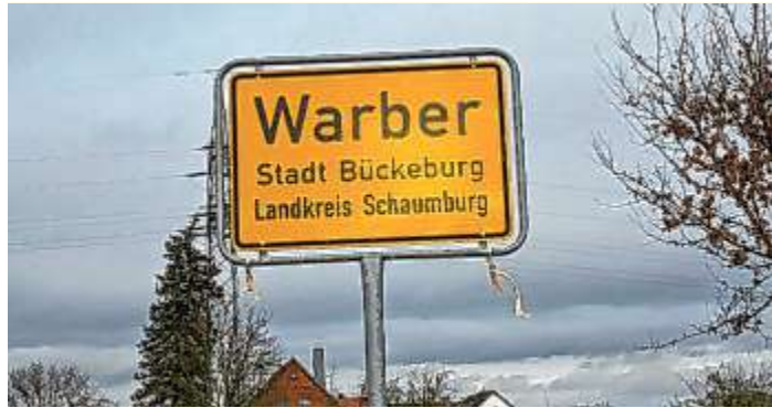
Die Zugehörigkeitsfrage in Warber (und Rusbend) ist wieder geklärt.

Angefangen hatte die Verwirrung sogar noch viel früher, nämlich mit der vermeintlichen Entdeckung eines über 100 Jahre alten Fehlers in der Kartierung. Schließlich entschied der Rat der Stadt Bückerburg, dass ein Teil der Warberaner eigentlich Rusbendern sein müssten und änderte das mit einem verhältnismäßig großen bürokratischen Aufwand. Der Ärger bei den „Betroffenen“ war aber bei Weitem größer. Jetzt – nach vielen Monaten – ist der Spuk wieder vorbei. Das Ende war nicht ganz so spektakulär wie das, was sich zuvor abspielte. Mitarbeiter des Bauhofs machten sich vor Kurzem beinahe unbemerkt an die Arbeit und tauschten die kleinen grünen Schilder an den Gemarkungen aus. Damit ist nun im Grunde wieder alles beim Alten. Ganz so einfach war die Änderung im Übrigen nicht. Fast ein Jahr mussten die Bewohner nun auf den Austausch